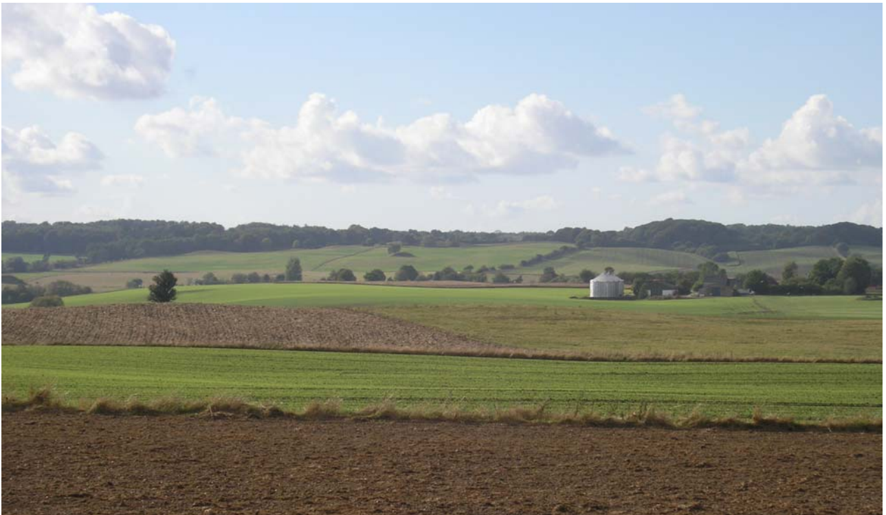
Tinghøje set fra Lyngageren

Tinghøje er to overpløjede gravhøje, hvor Ledreborg Birketings Rettersted tidligere fandtes. Højene kan stadig fornemmes som to højninger i landskabet, Her set fra øst mod vest med Ledreborg skovene i baggrunden.